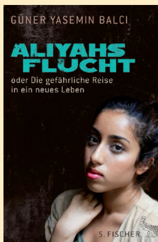
Liebesgeschichte einer Kurdin

Perlenschatz e. V. · Postfach 11 13 · 35599 Solms · Deutschland Telefon: 06442 9543994 · Telefax: 06442 9537692 · E-Mail: info@perlenschatz.info