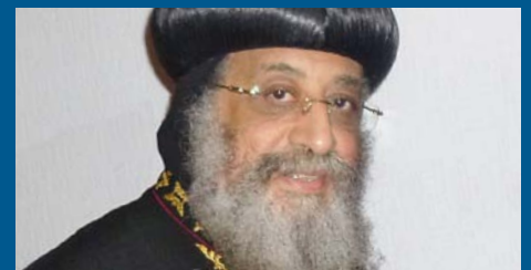
Papst Tawadros II Koptischer Patriarch von Alexandrien und Papst des Stuhls des heiligen Markus