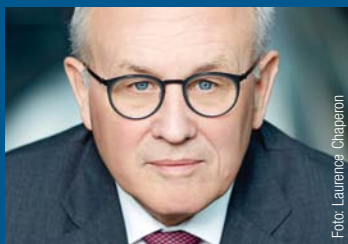
Volker Kauder Fraktionsvorsitzender der CDU/CSU im Bundestag