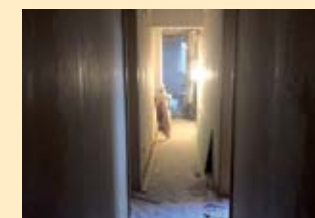
Neue Stromverteilung: Noch sieht es sehr nach Baustelle aus ...